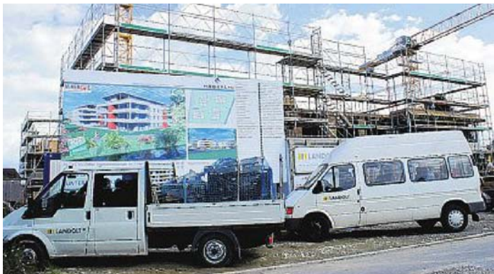
Dank Bauboom steigen auch die Mitgliederzahlen des HEV Steckborn

Mitgliederbeitrag: Fr. 40.– für EFH (inbegriffen ist das Zeitungsabo «Der Schweizerische Hauseigentümer».