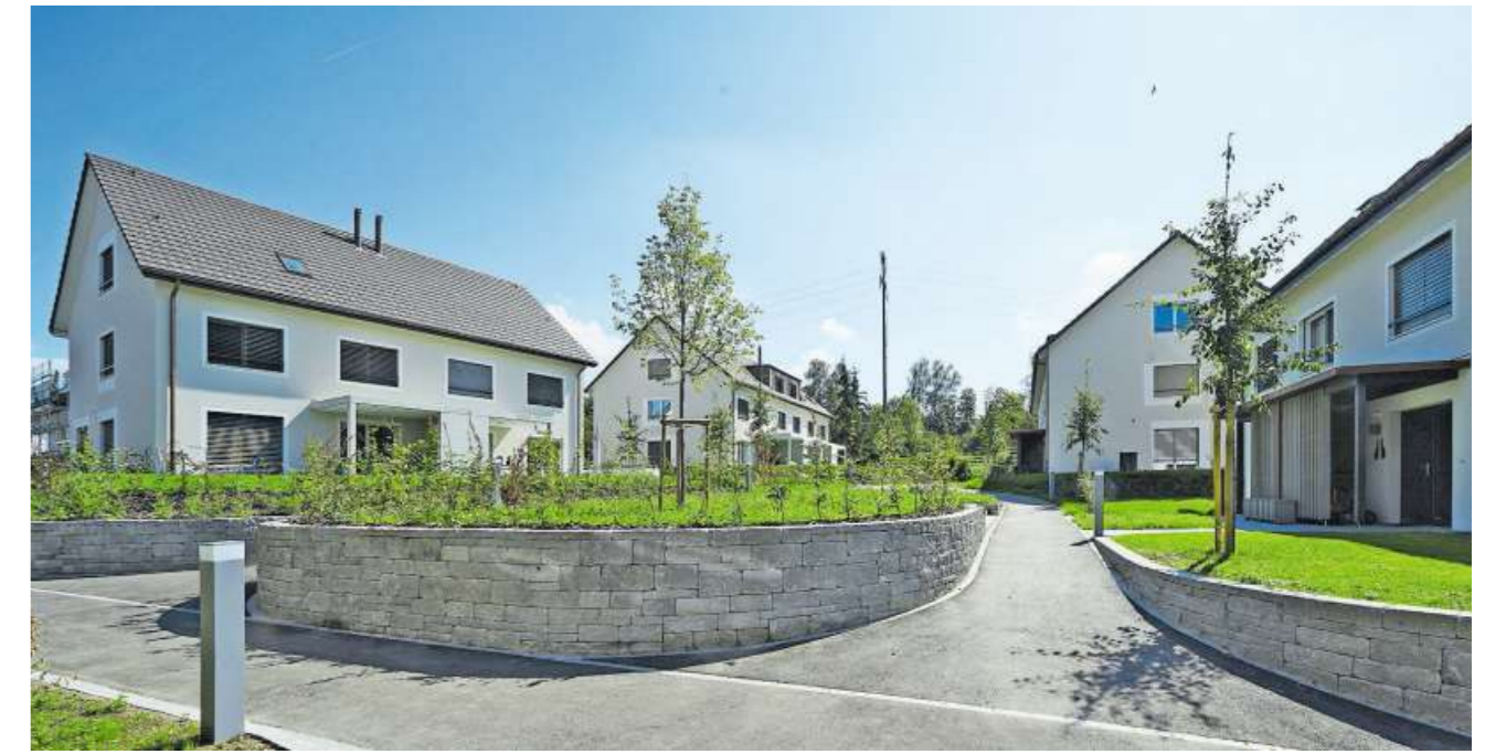
Die Überbauung «Im Dörfli» macht ihrem Namen alle Ehre.

Die Häberlin Architekten AG bedankt sich bei den Käuferinnen und Käufern für ihr Vertrauen und den an den Bauten beteiligten Unternehmen für die angenehme Zusammenarbeit. Ein spezieller Dank gilt zudem den Nachbarn für ihr grosses Verständnis während der Bauphase. (pd)