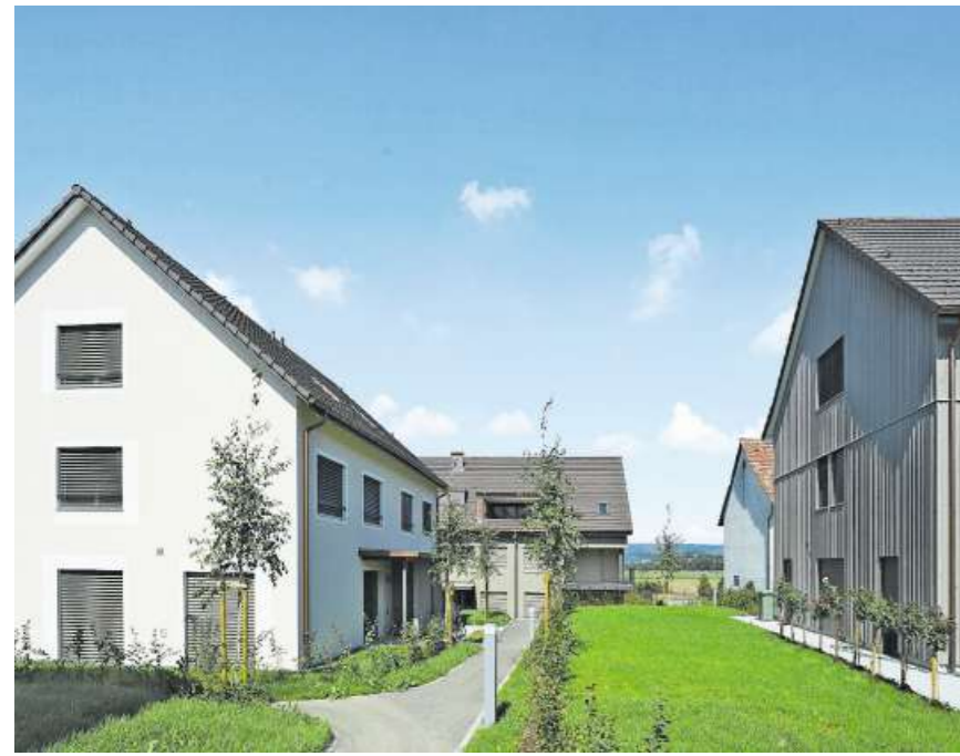
Eine Mischung von neu und alt macht den Charakter aus.