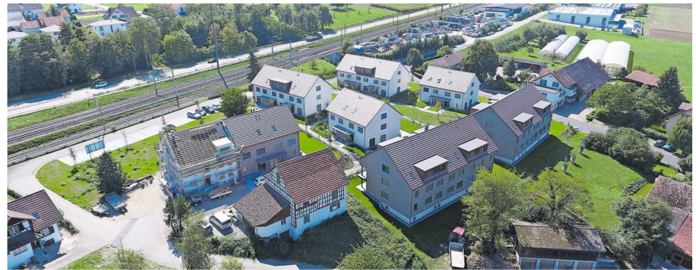
Die beiden Mehrfamilienhäuser mit je sechs Wohnungen sind gegen Süden ausgerichtet und bilden den Quartierabschluss.