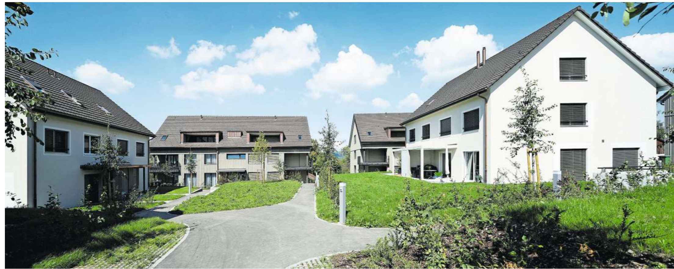
Die Doppel- und Reihenhäuser sowie Mehrfamilienhäuser sind in einem luftigen Abstand zueinander angeordnet. Im Herzen befindet sich eine Spiel- und Bewegungszone.

den Nachbarn in der Dorfwirtschaft Wiesental zusammen und informierte über das geplante Bauvorhaben. Durch die frühzeitige Information hat es letztendlich nur eine Einsprache gegeben, die gütlich gelöst werden konnte. 2013 wurde der Gestaltungsplan für die Parzelle bewilligt, und dem Projekt «Im Dörfli» stand nichts mehr im Wege. Auf einer Fläche von 8185 m 2 wurden die 24 Wohneinheiten von der Häberlin